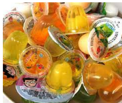
ゼリー・お菓子等のカップ・トレー用シート