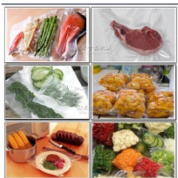
ハム・ソーセージ等の真空包装・ガスパック包装用フィルム